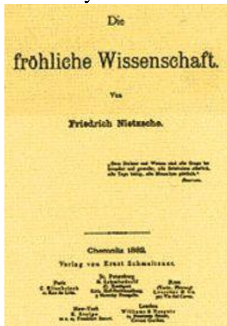
La Gaya Ciencia de Nietzsche – 1ra. Edición -Web

Fuera del prejuicioso ámbito romántico, que limita la expresión a restringidos ámbitos sensoriales, supuestamente repudiando el conocimiento, del que necesariamente se vale pese a ese rechazo discursivo superficial, el pensamiento científico se entrelazó con las expresiones artísticas y devino todo un acontecer notable, pretendidamente ignorado por ambas corrientes o formas de pensamiento y de acción.