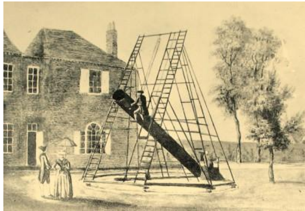
Los artistas Herschell con su telescopio

Fuera del prejuicioso ámbito romántico, que limita la expresión a restringidos ámbitos sensoriales, supuestamente repudiando el conocimiento, del que necesariamente se vale pese a ese rechazo discursivo superficial, el pensamiento científico se entrelazó con las expresiones artísticas y devino todo un acontecer notable, pretendidamente ignorado por ambas corrientes o formas de pensamiento y de acción.