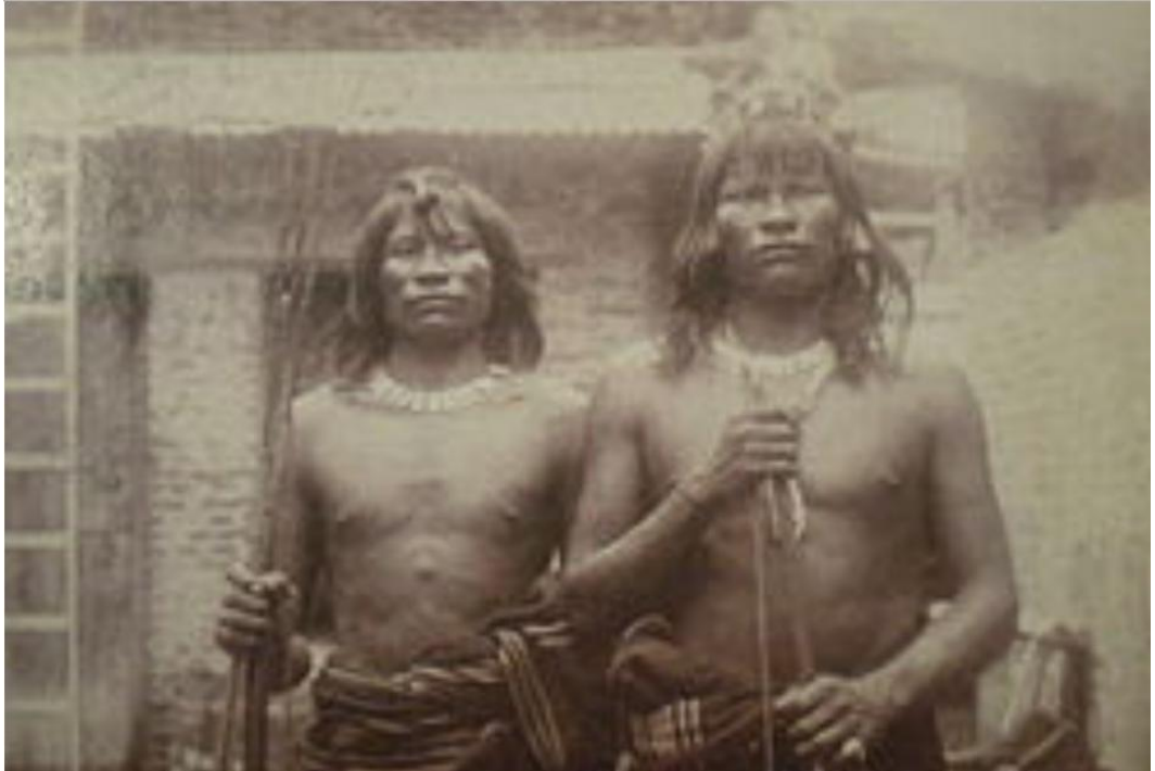
Cacique Pucurú – hacia 1900

La avenida que nace al 3200, en la Av. 9 de Julio de Resistencia, y que corre de S.E. a N.O. lleva el nombre “Ing. Arturo Seelstrang”.