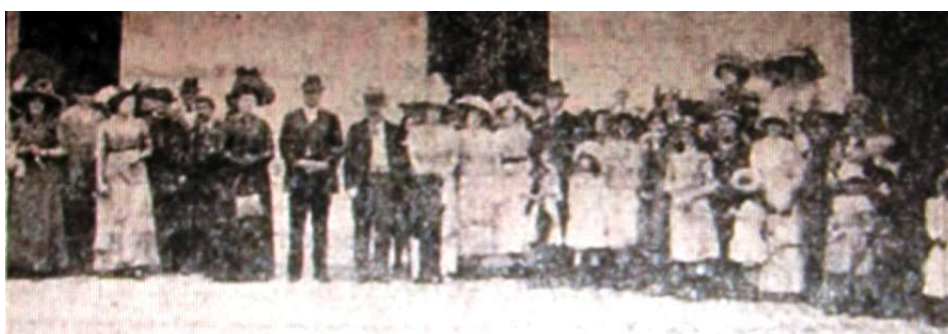
Asistentes a la inauguración del Hospital

Desde su terminación edilicia hasta su inauguración, transcurrió casi un año, tiempo demandado para la adquisición y traslado al lugar por vía fluvial del equipamiento especializado e insumos varios requeridos para su puesta en funcionamiento, adquiridos en Rosario y Buenos Aires.