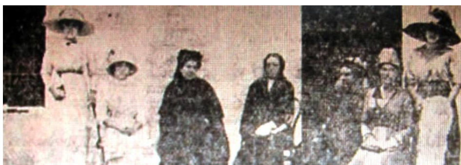
Grupo de damas de la Sociedad de Beneficencia – 1912

como “bazares” en las fiestas patrias, funciones cinematográficas (¡Ya en esa época!), etc.; de las que participó activamente la Sociedad de Beneficencia de San Javier, integrada por damas locales que mucho esfuerzo dedicaron al hospital a lo largo de su historia; la Sociedad contaba inicialmente con 134 socios. Su primer balance arrojó un ingreso de $8280,31.- y un egreso de $ 7.571,57.- al 31 de Diciembre de 1912.