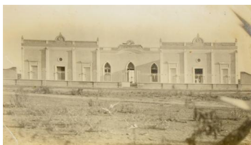
Vista panorámica del hospital al momento de su terminación – 1911

Durante su primer año de vida, se internaron en el mismo 113 pacientes, de los cuales fallecieron 5.