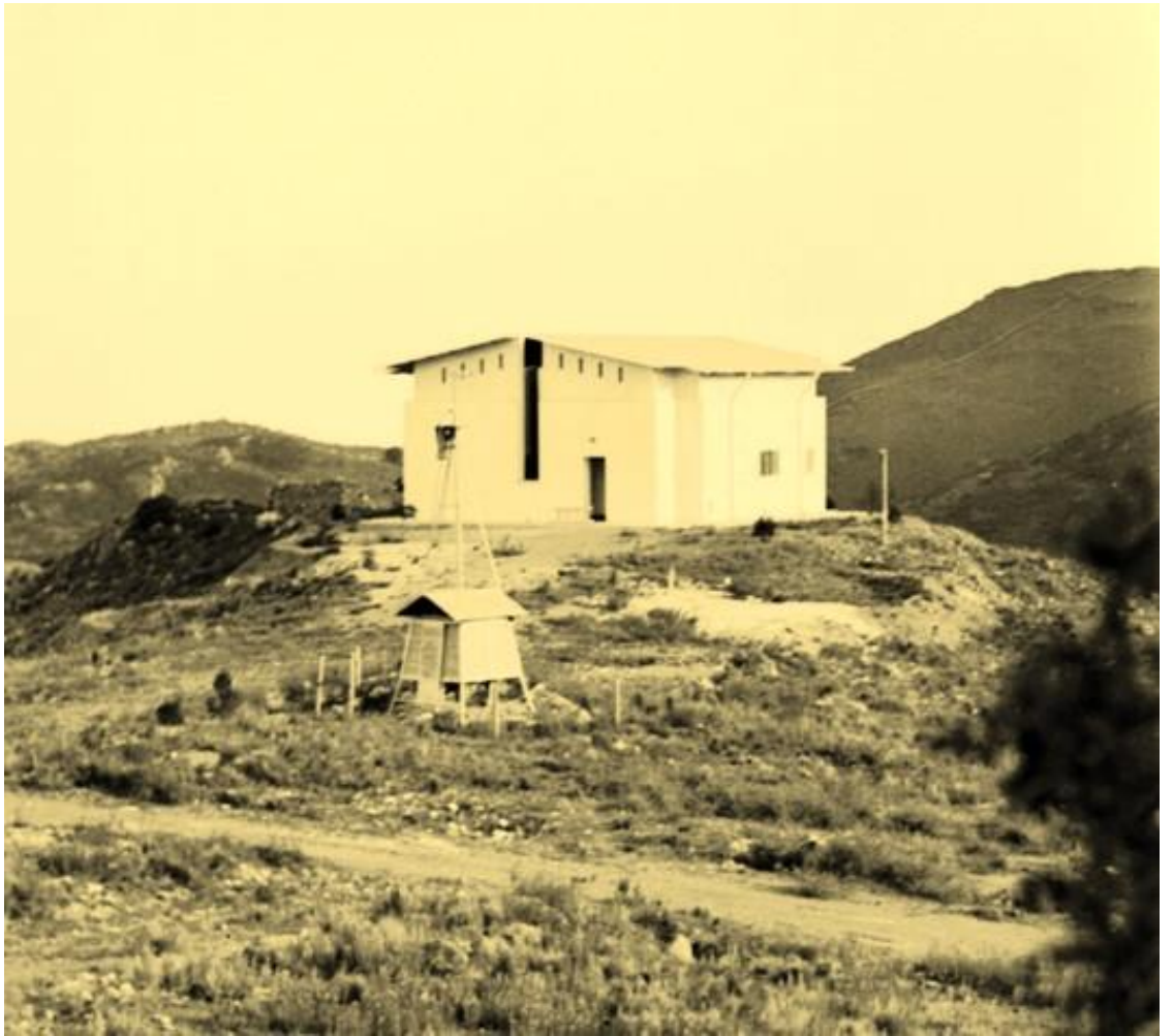
Estación meteorológica de la EABA