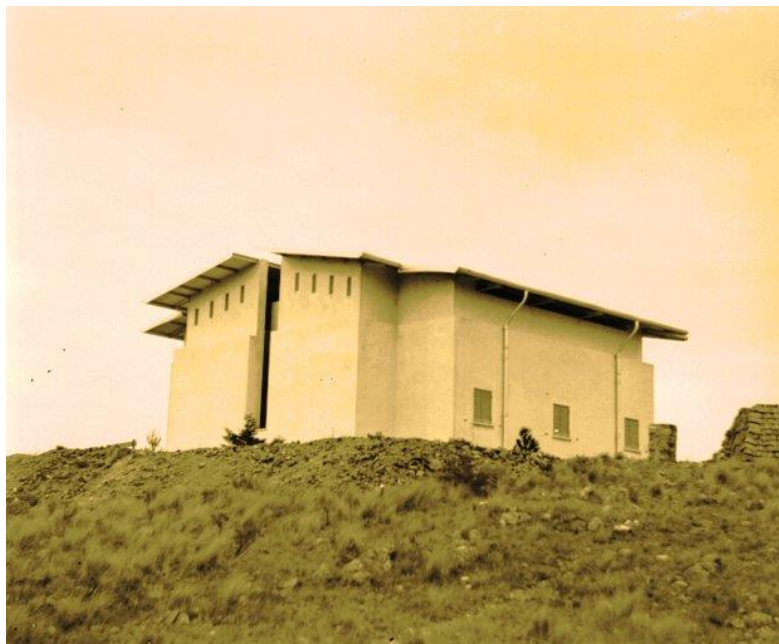
Refugio del Círculo Meridiano concluido – CE.