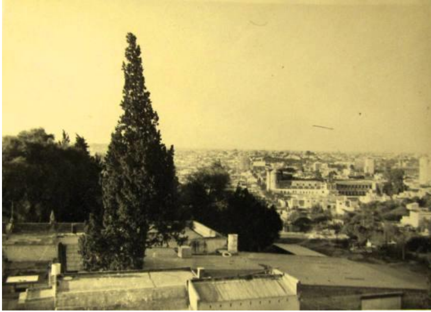
Córdoba vista desde la torre de la Est. Meteor. Cba.

En 1953 realiza en Buenos Aires nuevas capacitaciones y se desempeña como Inspector de Estaciones Meteorológicas.