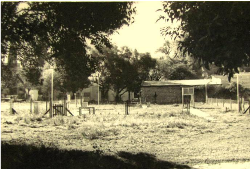
Of. Met. Cba – Campo de observación

Se jubiló como Jefe de la Estación Meteorológica sita en calle Laprida 808 en el año 1985.