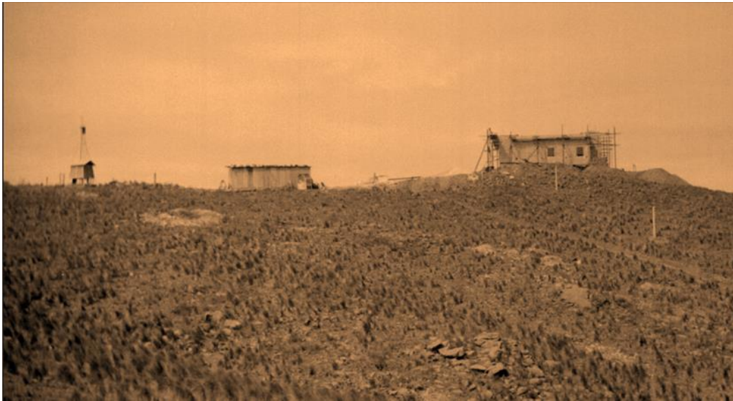
El pabellón en construcción – OAC – SP.-

Ya nadie recuerda que en la Estación Astrofísica de Bosque Alegre existió una estación Meteorológica compartida por el Observatorio Astronómico de Córdoba y el Servicio Meteorológico Argentino.