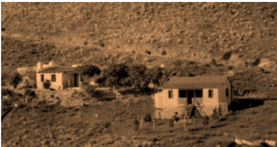
Casa residencia de Cagliolo en Bosque Alegre – OC-SP

Los primeros instrumentos meteorológicos precarios fueron instalados bajo la dirección de Charles Dillon Perrine enfrente del albergue preparado para el Círculo Meridiano nunca emplazado y que posteriormente fue el local de la Escuela Nacional Maestro Honorio Quiroga (Ver “la escuela del Cielo”).