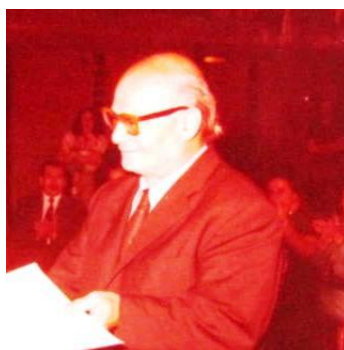
Una de sus últimas fotografías.

Falleció en Córdoba el 2 de Mayo del 2000