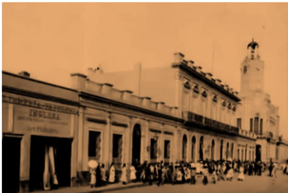
Salida de los alumnos en la época – Web.

Lauría participó activamente el domingo 15 de Abril de 1888, de la inauguración en Paraná del Observatorio Astronómico y Meteorológico del doctor Sixto Adolfo de Perini, apadrinado por el Ministro de Gobierno de Entre Ríos, doctor Ramón Calderón.