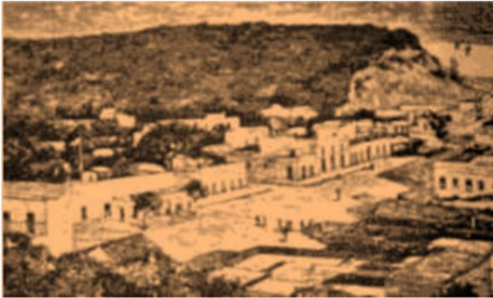
Vista de Paraná en 1880