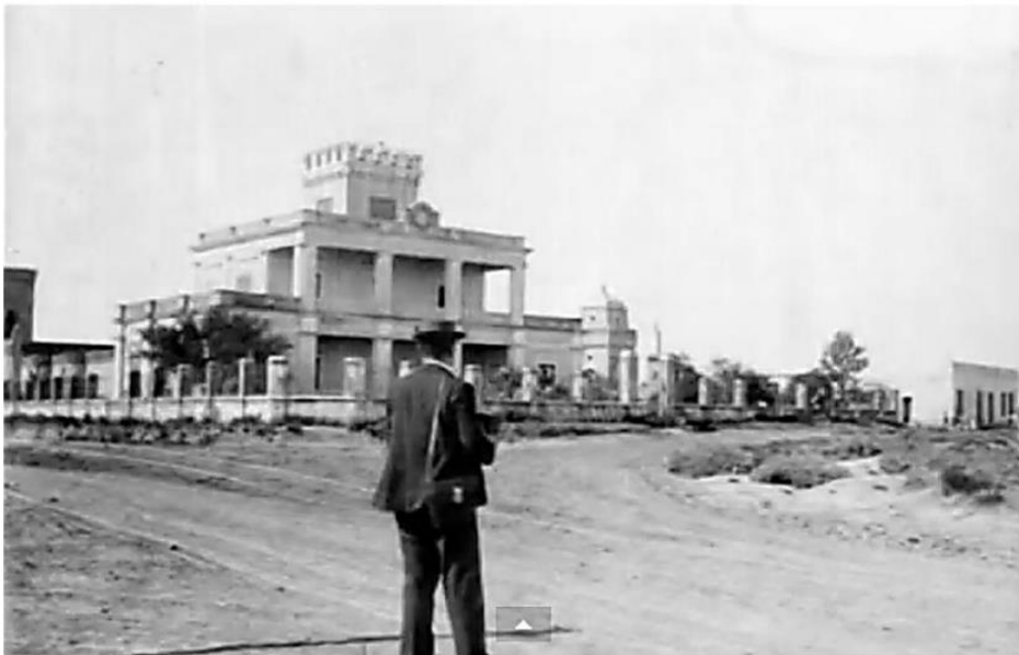
Panorámica del lugar – comienzos siglo XX - Web