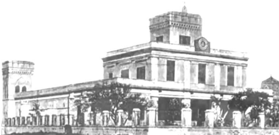
Lugar de emplazamiento del Observatorio