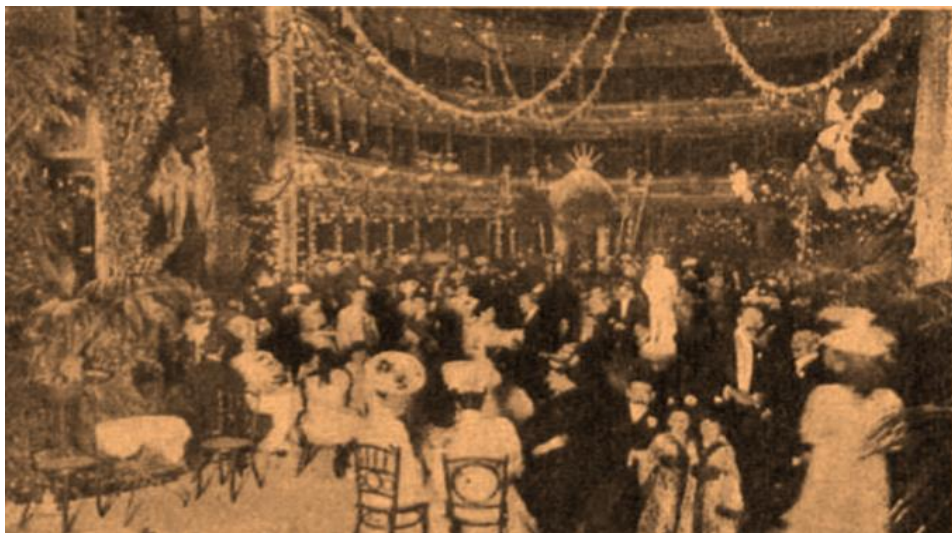
Teatro Rivera Indarte el último día de la fiesta