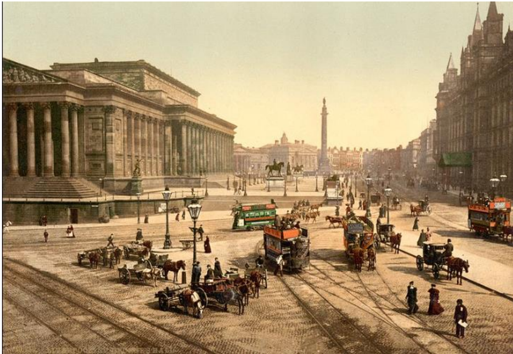
Liverpool (Calle Lme) en el siglo XIX