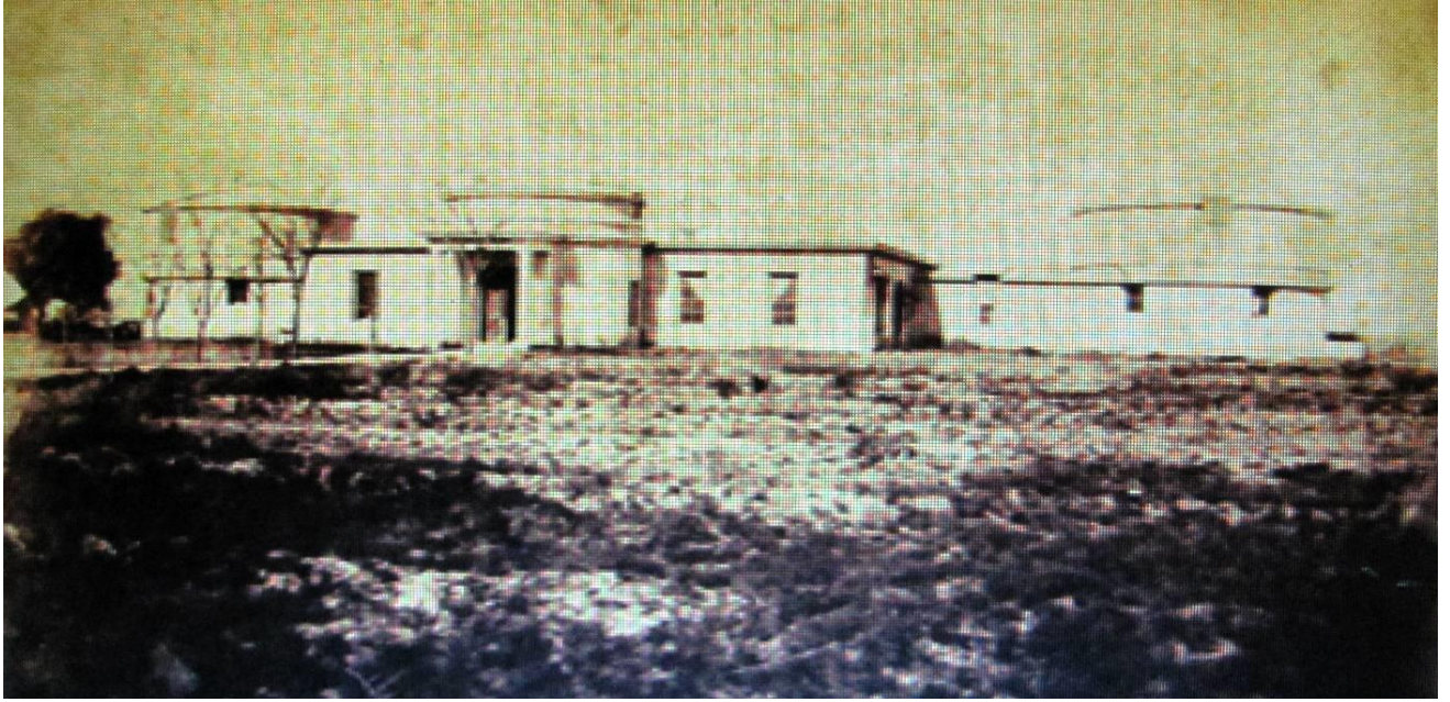
ONA – Pilcher - 1875 - Fotografía Argentina Científica y Técnica – 2006 - Web

El ONA tuvo un papel protagónico en la fotografía científica cordobesa de fines del siglo XIX con trascendencia internacional; si bien nos ocupamos de ello exhaustivamente en nuestra obra “Córdoba Estelar”, vale la pena recordar nuevamente que en los últimos días de su gobierno, Sarmiento promovió la aceptación de las invitaciones a las exposiciones de Londres, Filadelfia y Santiago de Chile. En especial la que nos interesa es la de Filadelfia, que tendría lugar en 1876 durante los festejos