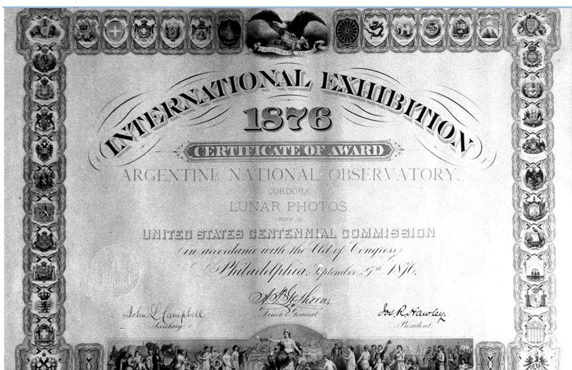
Diploma otorgado al Observatorio Nacional Argentino en 1876 por las fotografías lunares