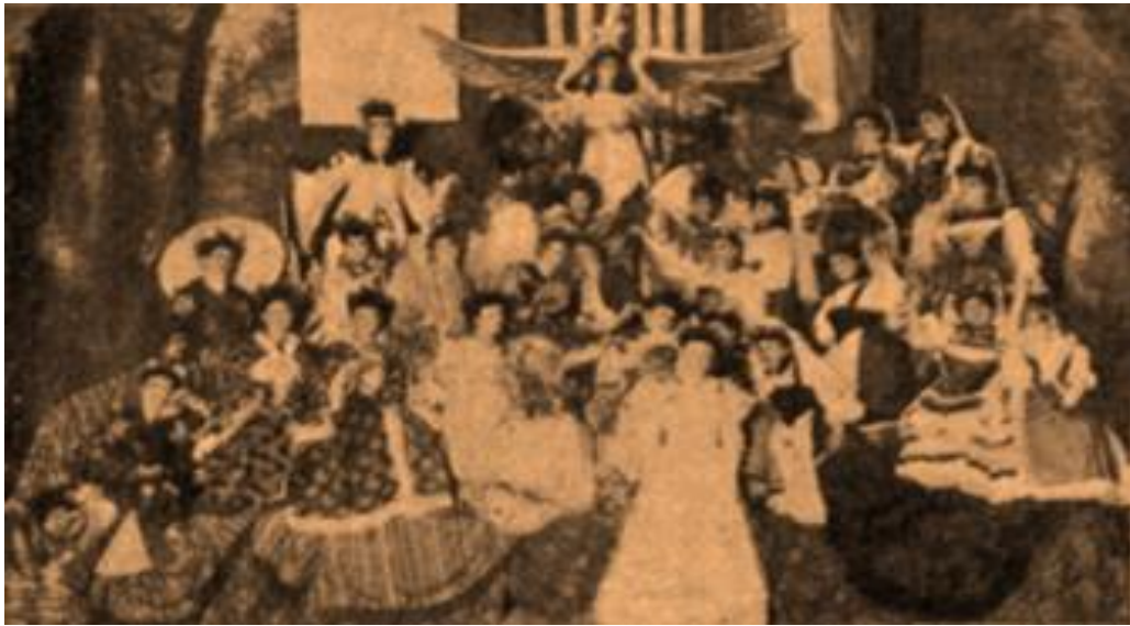
Cuadros alegóricos, la paz ruso-japonesa– CyC.

No podemos dejar de recordar que esa paz sobrevino al triunfo de la armada japonesa sobre la poderosa flota rusa, como consecuencia de la cesión por la Argentina al Japón de dos modernos acorazados. Allí nació ese sentimiento tan particular de ellos hacia nosotros, que hoy sobrevive.