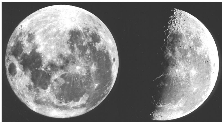
Fotografías de la Luna, obtenidas en el Observatorio Nacional y premiadas en la Exposición de Filadelfia realizada en 1876.