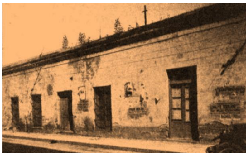
Casa donde se firmó el Pacto de San Nicolás de los Arroyos – Caras y Caretas.

Restableció la libertad de prensa y trató de establecer nuevamente la normalidad institucional en el país, para asegurar la reconstrucción nacional. Para ello firmó el Pacto de San Nicolás de los Arroyos, que sentó los cimientos de una organización constitucional nacional consensuada, pero la Asamblea de Buenos Aires se negó a aceptar dicho acuerdo. Ello condujo a López y Planes a presentar su dimisión irrevocable.