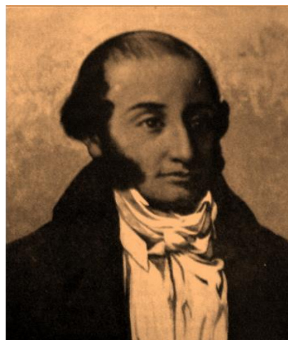
Vicente López y Planes y Blas Parera

A pedido de dicha Asamblea escribió la letra de lo que terminó siendo el Himno Nacional Argentino, cuya música compuso el catalán Blas Parera ; fue aprobado el 11 de mayo de 1813. Se entonó por primera vez en público en la tertulia realizada el sábado 7 de mayo de 1813 en la casa de Mariquita Sánchez de Thompson .