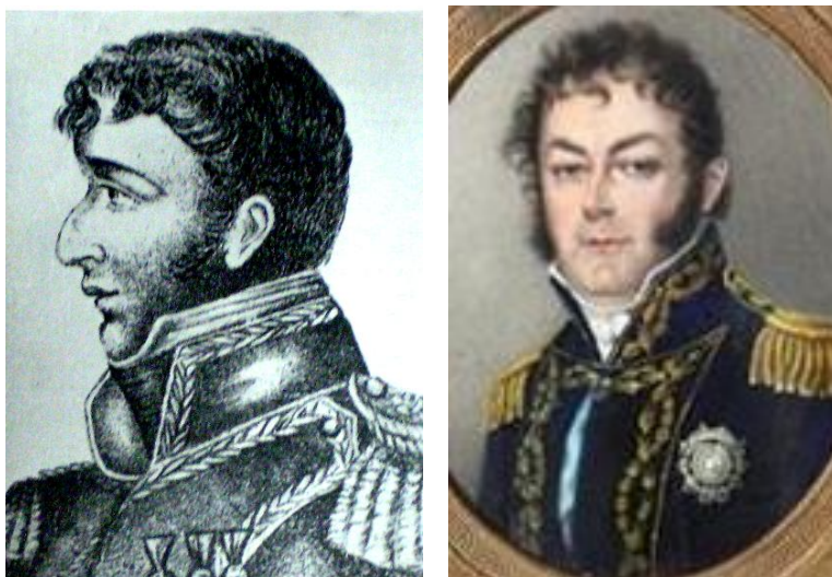
Balcarce y Pueyrredón

Actuó posteriormente como secretario en los gobiernos del Directorio de Balcarce y Pueyrredón . Este último lo nombró ministro de gobierno. En 1817 fue elegido miembro del Congreso Constituyente y en 1825 diputado del Congreso Nacional. Tras la caída del gobierno de Bernardino Rivadavia en 1827, llegó a ser el Presidente Provisional de las Provincias Unidas del Río de la Plata, entre el 7 de julio y el 18 de agosto de 1827.