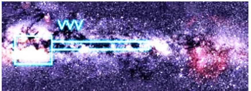
Área investigada con el programa VVV – ESO – Web