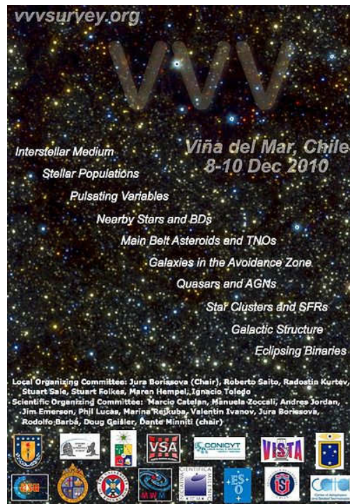
Afiche sobre la reunión VVV de Viña del Mar y sus tópicos diversos – OAC

La curiosidad humana prosigue más allá de ese umbral infrarrojo y con pie también en Latinoamérica – como en otros lugares del mundo - se desarrolla un ambicioso programa para la exploración del cosmos en las ondas de radio.