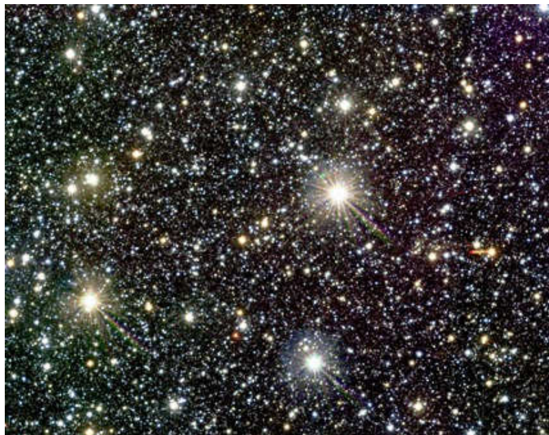
Un pequeño sector de una de las placas del VVV Survey

La encuesta internacional VVV que se lleva a cabo desde Chile mediante imágenes obtenidas con el telescopio VISTA (un telescopio de 4,1 metros, y su cámara de infrarrojo cercano VIRCAM), se centra en el bulbo galáctico y un sector escogido del plano galáctico en las bandas Z, Y, J, H y K del infrarrojo, cubriendo un área celeste de 520° cuadrados. En la misma participan activamente astrónomos de diversos centros prestigiosos de investigación del mundo, entre los que se encuentran muchos latinoamericanos (de Argentina, Chile y Brasil). VVV permite un acceso más profundo a la Vía Láctea en sus zonas de mayor densidad, facilitando establecer su estructura y evolución, entre otras muchas posibilidades insospechadas que van surgiendo a medida que los investigadores trabajan.