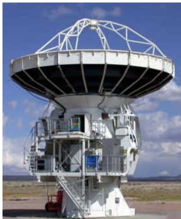
LLAMA - Antena prototipo propuesta – NRAO - IAR

("Large Latin American Millimeter Array")