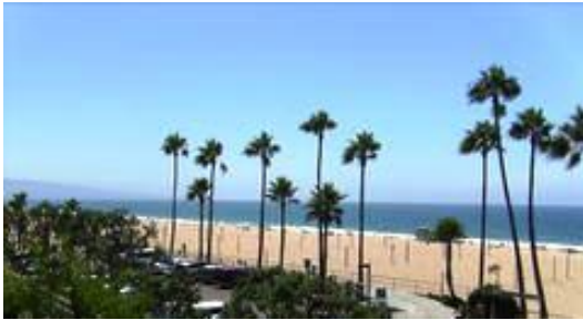
Hermosa Beach - Web

En la misma revista, pero en el año 1924, Charles Dillon Perrine , director del Observatorio Nacional Argentino publicó su trabajo “On the Cause of Green Ray Seen at Sunset” que escribiera en Hermosa, playa de California, en oportunidad de su traslado a Estados Unidos por una licencia que le fuera concedida y que materializó en Agosto de 1923.