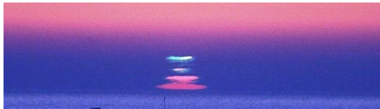
El rayo verde en el mar – Web