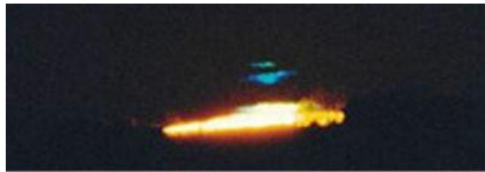
Rayo azul – Web

El “prisma” atmosférico descompondría la luz generando un pequeño espectro que se extiende de abajo arriba, con el rojo en la posición inferior, determinando que el Sol se vea ornado con una corona verde – según algunos, también a veces de azul brillante – tan fugaz, como el amor de mujer bonita.