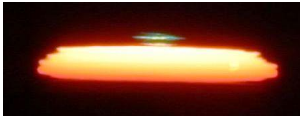
Rayo verde

Las primeras noticias de ese fenómeno extraordinario de la naturaleza llegaron en manos de Julio Verne con su clásico “El Rayo Verde” (Le Rayon Vert, originalmente publicado por entregas en Le Temps en 1882). La historia, que conmovió la mente juvenil, fue olvidada hasta que un astrónomo de renombre, a propósito de su cita en la novela “Salvajes Palmeras del Pájaro Blanco”, comentó al autor que desde Mauna Kea en Hawai había sido espectador del fugaz fenómeno, al que tildó de espectacular.