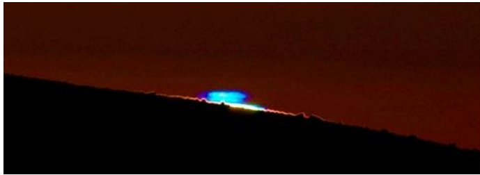
Rayo Verde en Paranal – European Southern Observatory (ESO) – 2008 – Web

Grupo de Investigación en Enseñanza, Historia y Divulgación de la Astronomía- Observatorio de Córdoba - historiadelaastronomia.wordpress.com – HistoLIADA