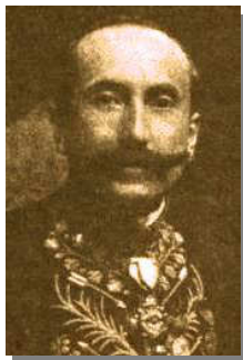
Amado Nervo en la madurez

Juan Crisóstomo Ruiz de Nervo y Ordaz que así se llamaba, utilizaba el seudónimo de Amado Nervo y Ordaz , una de las máximas expresiones mexicanas del movimiento literario modernista, nació el 27 de Agosto de 1870 en la localidad de Tepic (Entonces Jalisco, hoy Nayarit).