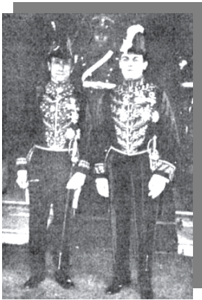
Amado Nervo en la Presidencia de la Nación - CyC

El 22 de marzo ofreció sus cartas credenciales al presidente de Argentina. La imagen lo muestra saliendo del acto protocolar acompañado de un secretario del anfitrión.