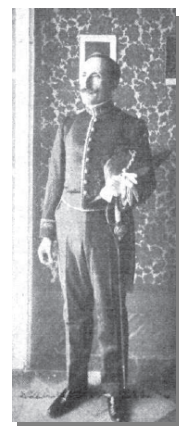
Nervo con su telescopio y con el uniforme de gala – CyC

Con escala en Río de Janeiro, Brasil, a finales de febrero Amado Nervo desembarca en Montevideo, Uruguay.