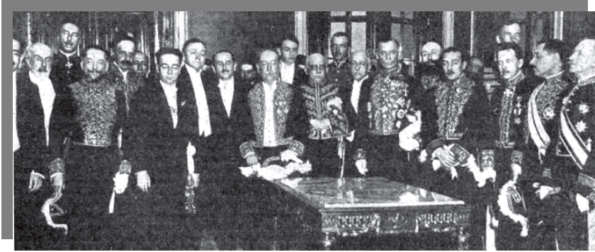
Montevideo-Embajadores extranjeros con el flamante presidente uruguayo - CyC

El 27 de febrero de 1919 presenta cartas credenciales al presidente de Uruguay. En Montevideo, asiste como embajador extraordinario al cambio de poderes de la presidencia.