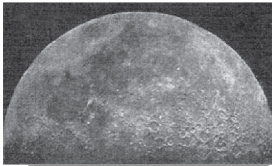
Imagen de la Luna tomada por Nervo con una cámara de su construcción - 1906 – CyC

Durante 1894 se radicó en ciudad de México, colaborando con diversos periódicos y revistas, llegando a integrar el directorio de “El Mundo”. En 1897 dirige una publicación independizada del mismo: “El Cómic”. En el período publica una novela y alguna obra poética. Pasa a dirigir la Revista Moderna hasta 1900 en que se traslada a París como corresponsal de “El Imparcial”; en 1905 el periódico prescindió de sus servicios, sumiéndolo en la pobreza. En ese período es nominado para ocupar el cargo de Segundo Secretario de la Embajada Española en Madrid y Lisboa. El 29 de Agosto de 1905 abandonó París para trasladarse a España por el país vasco, donde se hallaba en ese momento el embajador José Antonio Béistegui . Arriba a Madrid el 2 de Setiembre de 1905 y toma posesión del cargo. Recordemos que en interín – 30 de Agosto - ocurre el eclipse de Sol cuya faja de totalidad cubría el sur de España, asiento de diversas legaciones científicas para su observación. Digamos que Nervo eludió el eclipse en este periplo.