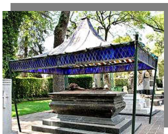
Rotonda de Personas Ilustres – Sepulcro de Amado Nervo – México – Web

El 10 de noviembre luego de una travesía continental, la Uruguay llega al puerto de Veracruz con los restos mortales de Amado Nervo. Su sepultura con grandes homenajes internacionales se llevó a cabo en la ciudad de México en la entonces Rotonda de los Hombres Ilustres, el 14 de Noviembre de 1919.