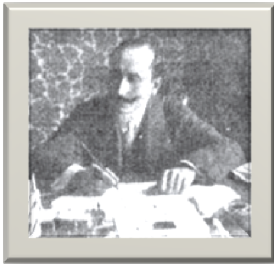
Amado Nervo en Madrid - 1907

Inusitadamente nos encontramos así, de pronto, con un Amado Nervo no solo poeta y diplomático, sino astrónomo aficionado totalmente olvidado como tal. Tanto que en nuestra nota sobre la historia de la astronomía mexicana, en la parte correspondiente a la práctica no profesional, lo ignoramos olímpicamente por franco desconocimiento de una circunstancia que a todas luces debe destacarse; máxime teniendo en cuenta que en su momento nos ocupamos en otros trabajos sobre el vínculo existente entre la ciencia astronómica y el arte, también desestimando ello por las mismas circunstancias. Constituye este hecho una evidencia más de la gran ignorancia existente en nuestra Latinoamérica de la práctica astronómica en segundas líneas, tanto profesional como amateur. Insistimos en la necesidad de profundizar ahora la investigación sobre ello, antes que el cambio de soporte de la información, del papel a las memorias de silicio, haga que se pierdan definitivamente hechos importantes de una práctica relevante injustamente olvidada.