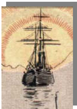
Corbeta Uruguay – dibujo de la época – CyC

Su cadáver fue trasladado al país de origen por la corbeta Uruguay. Tenía 48 años de edad.